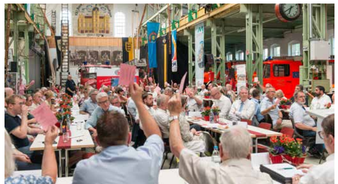
Abstimmung über die Ausschüttung der Dividende