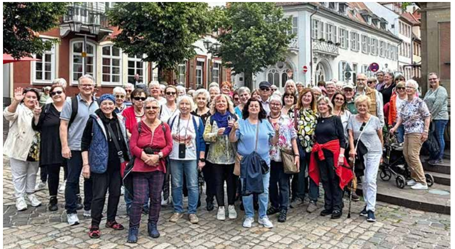
Die Reisegruppe am 3. Juni