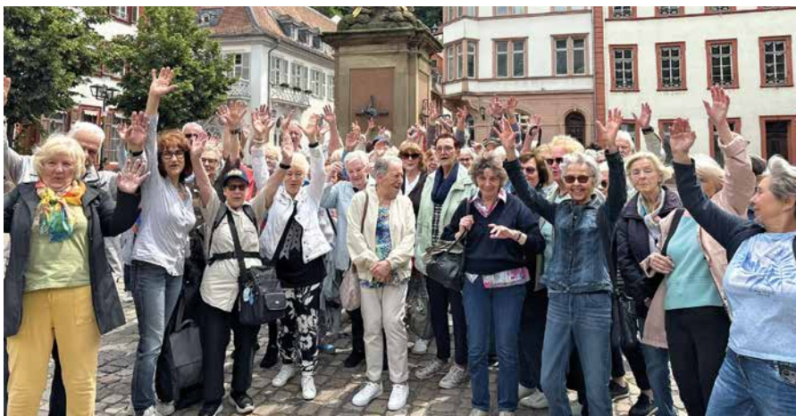
Die Reisegruppe am 5. Juni

Zum Abschluss kehrte die Gruppe im traditionsreichen Restaurant „Goldener Falke“ in der Heidelberger Altstadt ein. Bei regionaler Küche und gemütllicher Atmosphäre ließen die Gäste den schönen Tag noch einmal Revue passieren, bevor es gegen 16 Uhr wieder zurück nach Stuttgart ging.