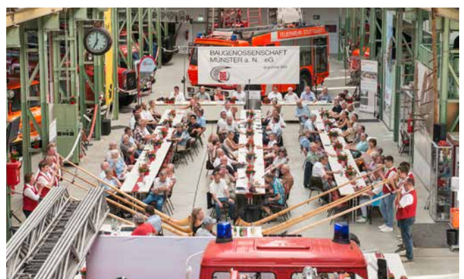
Musikalischer Ausklang mit den Alphornbläsern des Hofener Musikvereins

Erneut durften wir die Gruppe Almrausch des Musikverein Stuttgart-Hofen e. V. begrüßen, die uns einige Stücke mit ihren Alphörnern vortrug.